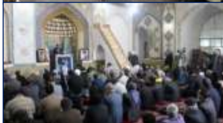
سخنرانی رئیس دانشگاه علوم پزشکی استان سمنان در نماز جمعه در راستای پویش ملی سلامت ۱۴۰۲/۱۰/۲۳