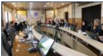
دومین کمیته فنی نان کامل و غذای سالم در سفره مردم در دانشگاه برگزار شد ۱۴۰۲/۱۰/۲۰