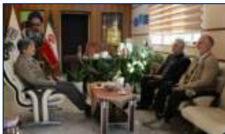
دیدار رئیس دانشگاه آزاد اسلامی استان سمنان با رئیس دانشگاه علوم پزشکی استان سمنان ۱۴۰۲/۱۰/۲۰