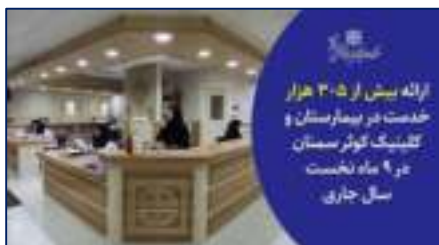
ارائه بیش از ۳۰۵ هزار خدمت در بیمارستان و کلینیک کوثر سمنان در ۹ ماه نخست سال جاری